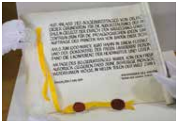
Urkunde zum 80. Geburtstag von Kurt Hahn, 1966

Unser Archivgut steht jedem interessierten Bürger auf Antrag offen. Bitte melden Sie sich für die Benutzung per Telefon oder via E-Mail an.