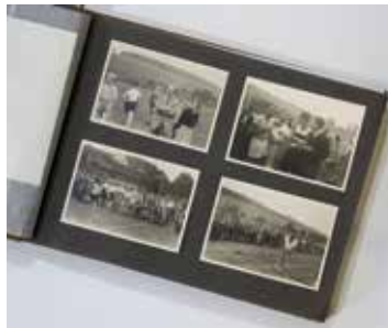
Schülerfotoalbum, 1920er Jahre

Die Sammlung umfasst rund 200 Meter Archivgut. Sie enthält politische und pädagogische Schriften