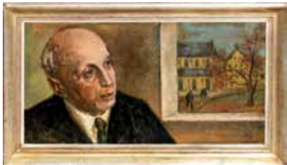
Portrait Kurt Hahn, 1967

Das Kurt-Hahn-Archiv sammelt und bewahrt Unterlagen zu Kurt Hahn, dem Pädagogen und Mitbegründer der Schule Schloss Salem. Es ist damit eine wichtige Anlaufstelle für alle Fragen zur Person Kurt Hahns, zur Geschichte der Schule sowie zur Entwicklung der deutschen Reformpädagogik. Das Archiv