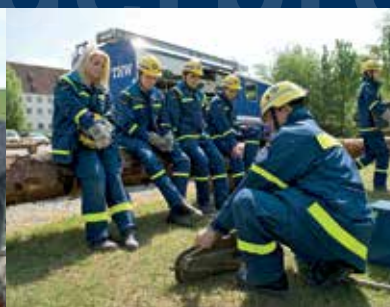
THW / Emergency Service