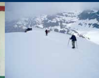
Schneeschuhe / Snow shoes