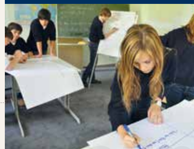
Unterricht / Lessons

Mitglieder der Friends of Salem Association seit 2006