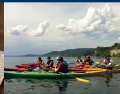
Seekajaks / Lake Kayaks