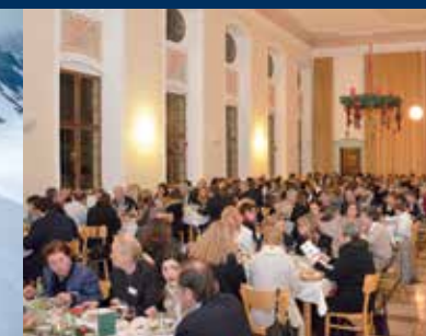
Weihnachtessen / Christmas dinner