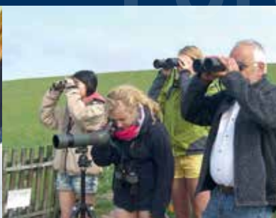
Ferngläser / Binoculars