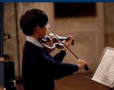
Musik / Music