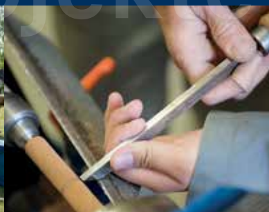
Drechselbank / Lathe