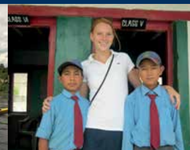
Round Square Reise / Round Square journey