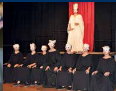
Theater-AG / Drama department