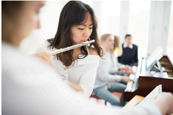
Salemer Schülerinnen.